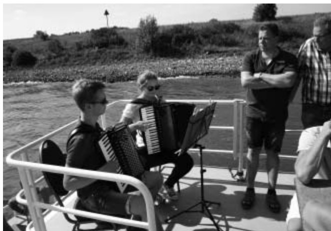
Vervolgens op de boot van De nieuwe aanleg en onder het genot van een drankje en muzikale begeleiding richting Almen.