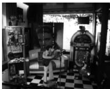
Het bezoek aan de mosterd-fabriek (rechts) en vervolgens op naar het Elvis Museum (links)