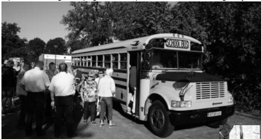
Met een oude schoolbus op weg naar doetinchem.

Op deze en volgende pagina een impressie van deze onvergetelijke dag.