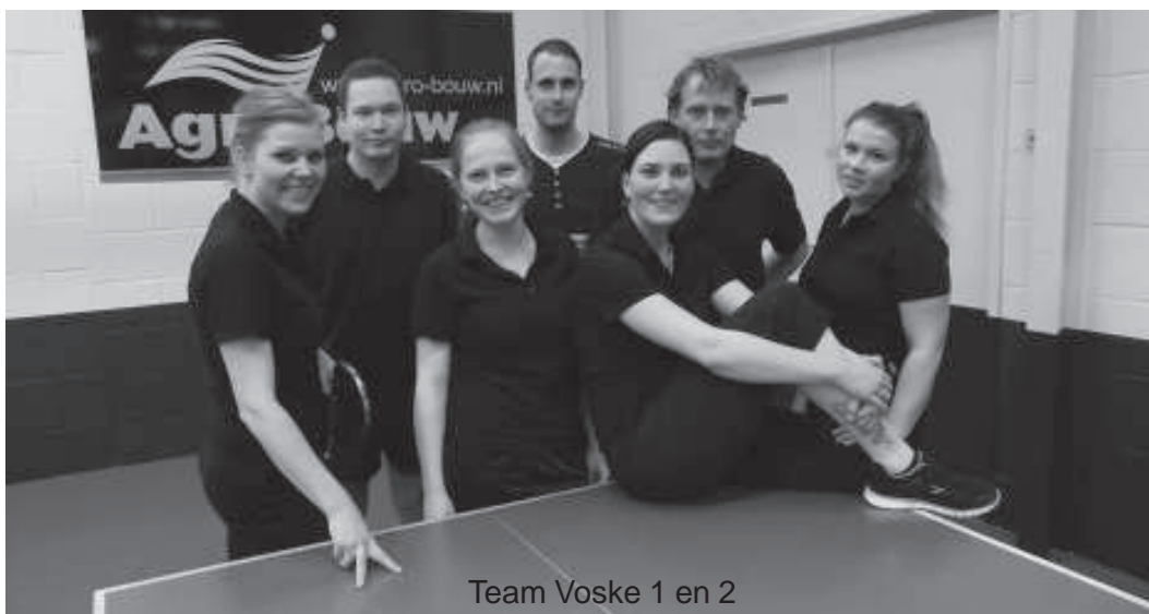
Team Voske 1 en 2