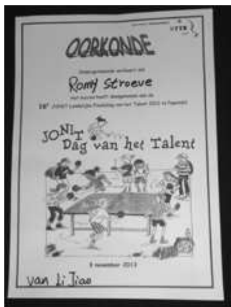
Geschreven door Romy Stroeve

En ik ben met haar op de foto geweest. En toen kregen we een oorkonde. Behalve ik. Want ze waren mij vergeten. En toen kreeg ik later wel een oorkonde. En links onderaan stond: van Li Jiao.