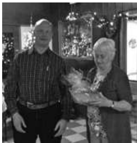
Een prijs voor de nummer 2 met jokeren