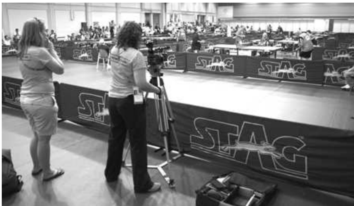
Het mediateam is op bezoek doet interviews en filmt.