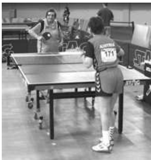
Marina in actie

Zodra Geert zijn laatste partij heeft gespeeld hoor ik van de organisatie dat dit de laatste ronde van deze dag is... (we vliegen naar de bus zodat we deze nog op tijd kunnen nemen (het is 18:15 uur en de laatste bus naar het hotel vertrekt om 18:15). We zitten goed en wel in de bus als deze vertrekt).