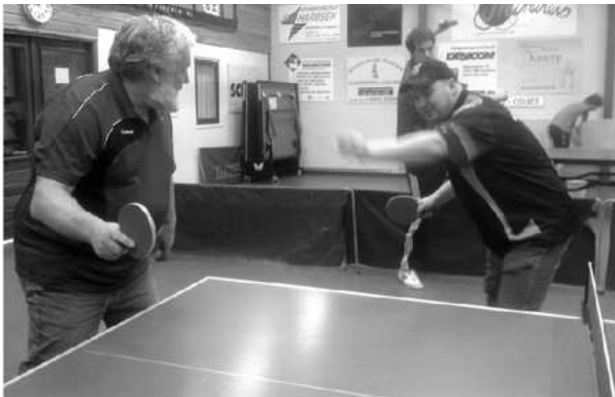
Chrizzzly(links) in de basishouding: Gereed om toe te slaan!

Chris: Daar nemen we er eentje op Beelski!