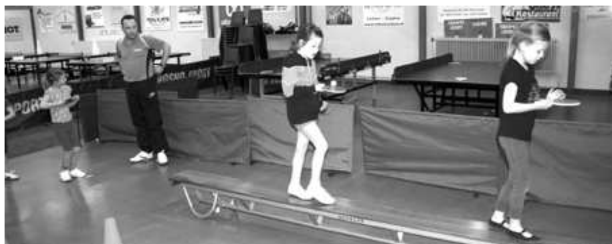
Balanceren met een bal

Op het programma stonden de onderdelen schuiftafeltennis, bekertjes proberen omver te tafeltennissen, de bal in een paraplu slaan met een batje, balanceren met een bal op een batje terwijl je over een smalle bank loopt en het spel "rondom de tafel".