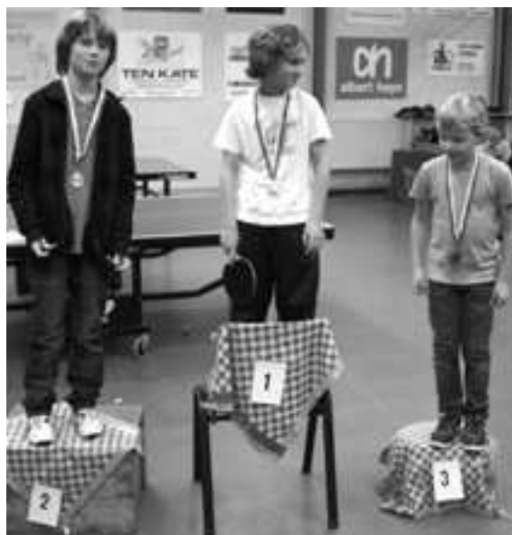
jongens groep 6