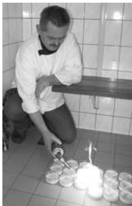
Het vlamme gedeelte... de crème brulee