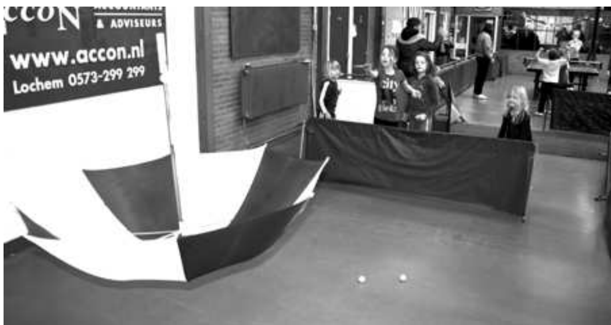
Bal in een paraplu slaan

Het circuit bleek een gouden greep want alle leerlingen genoten zichtbaar. In de pauze stond er voor iedereen een bekertje ranja en wat lekkers klaar. Om half één keerden de leerlingen, een stukje tafeltenniswijzer, huiswaarts.