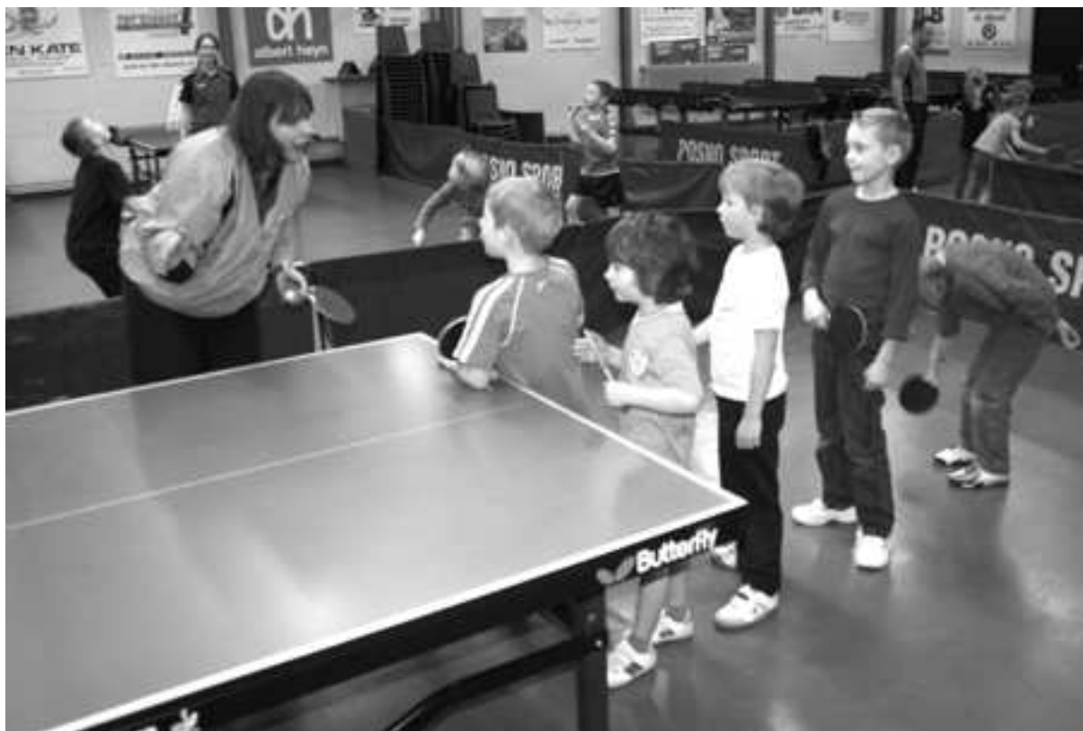
Rondom de tafel

Het circuit bleek een gouden greep want alle leerlingen genoten zichtbaar. In de pauze stond er voor iedereen een bekertje ranja en wat lekkers klaar. Om half één keerden de leerlingen, een stukje tafeltenniswijzer, huiswaarts.