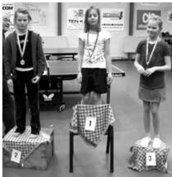
meisjes groep 6