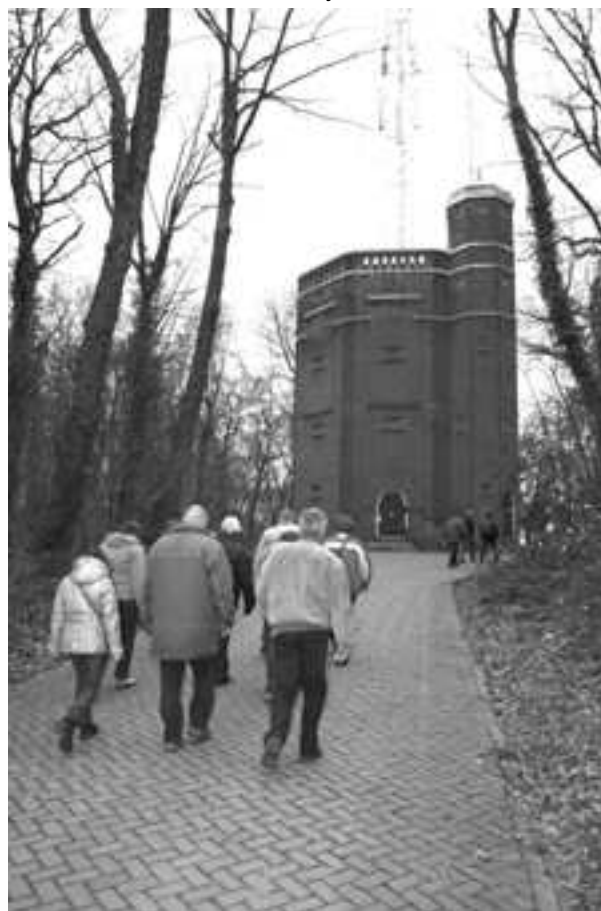
een rondje of drie om de toren