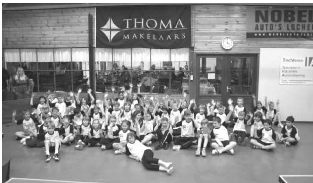
Alle deelnemers van de welpenmeerkampen 2010 Afdeling Oost

Afgelopen zondag (21 maart 2010) hebben maar liefst 49 welpen deelgenomen aan de welpenmeerkampen van Afdeling Oost. Een record dat er zo veel enthousiaste jeugdleden en hun begeleiders zijn afgereisd naar tafeltennisvereniging De Toekomst in Lochem. De hele regio was vertegenwoordigd; van Harderwijk tot Enschede en van Zutphen tot Wijhe. Het niveau van de jeugd varieerde van echte beginners tot de al wat meer ervaren competitie-spelers die soms zelfs al deelnemen aan de Regionale Bondstraining.