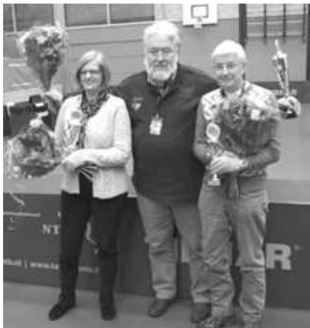
Foto hierboven. De 3 genomineerden