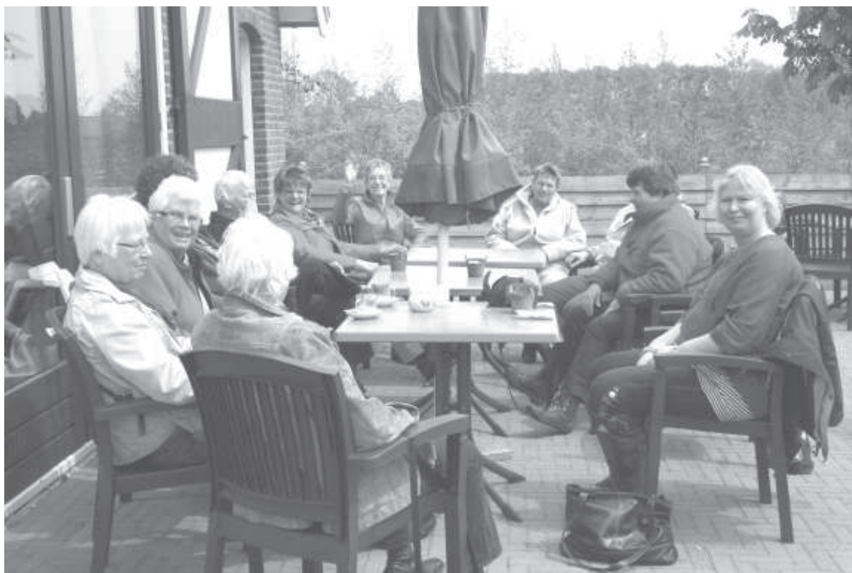
De Lady's in afwachting voor het koud en warm buffet

Daarna hebben we wat gedronken en vervolgens we met een spreuken puzzeltocht. De ene ploeg ging eerst buiten de spreuken opzoeken en de andere ploeg binnen en andersom.. Tegen half 5 werd de barbecue aangezet en hebben we met z'n allen heerlijk gegeten van het warme en koude buffet.