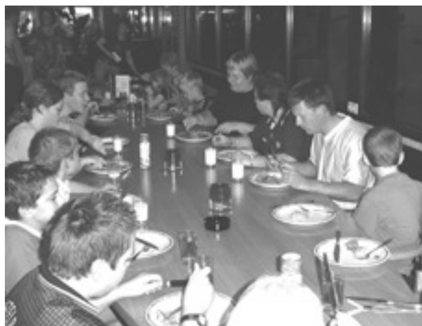
Lekker eten met zijn allen na de zeskamp

Daarna is er een overheerlijk pannenkoekenbuffet met keuze uit warme kersen op siroop, uitgebakken spek, ananas en de gebruikelijke keukenkeuzes zoals appelstroop, strooisel