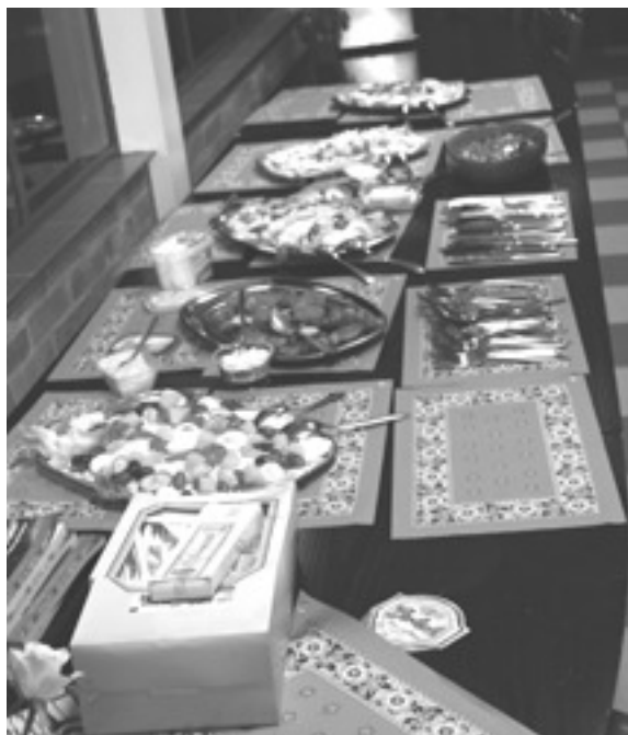
Tafel vol lekkere salades.

De mosselen waren in verschillende smaken te vinden; zoals gekookt met verschillende groente of zelf op z'n Belgisch met kaas in de oven. Later kwamen ze zelfs nog met mosselen in tomaten. De salade's waren er ook in meerdere smaken: zalmzalade, aardappelsalade en huzarensalade. Op tafel stonden een drietal sausen, waaronder knoflooksaus en nog twee die ik helaas niet kan noemen. Ook was er stokbrood met eigen gemaakte kruidenboter, ja er was voor iedereen we iets lekkers.