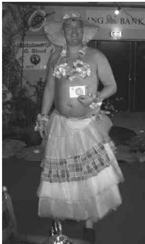
De man van HJ zien droome.