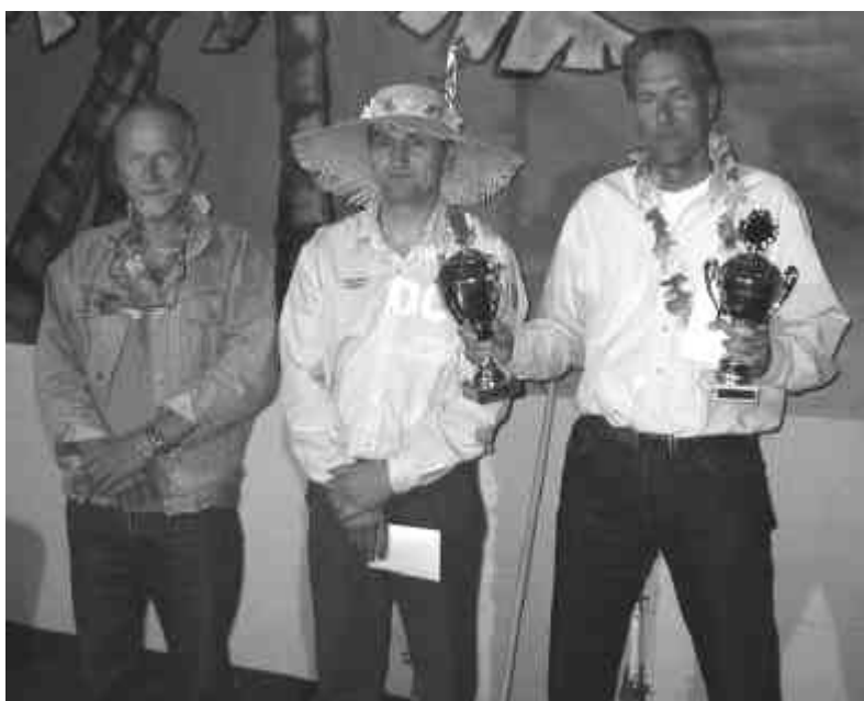
Het enige kampioensteam, gehuldigd op de seizoensafsluitavond in Caribische sferen.