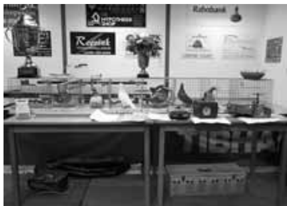
de postduivenvereniging Pax-Snelpost,