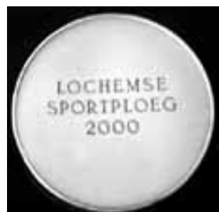
voor- en achterzijde van de gemeentepenning