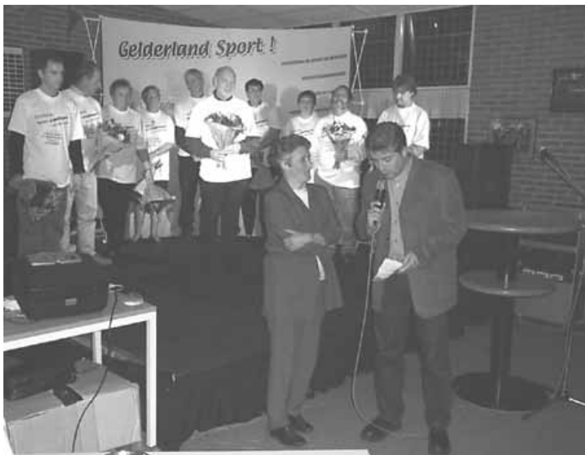
Alle genomineerde sportvrijwilligers op het podium