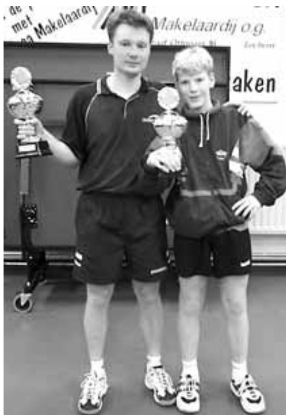
clubkampioen Senioren en Jeugd